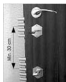
Zárési pontok távolsága

A zár reteszvasak egymástól mért távolsága.