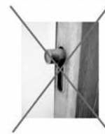
NEM záróási pont!