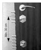
Zárési pontok távolsága

A zár reteszvasak egymástól mért távolsága.